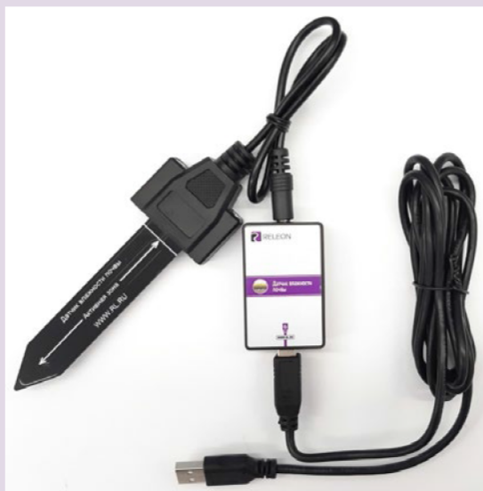
Рис. 4. Датчик влажности почвы

Датчик влажности почвы — предназначен для измерения степени увлажнения почвы, выраженной в процентах. Применяется в агроэкологических и сельскохозяйственных исследованиях.