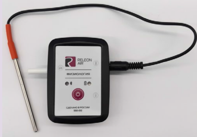
Рис. 12. Датчик температуры тела

Датчик температуры тела — предназначен для непрерывного измерения температуры тела в подмышечной впадине. Оснащён выносным зондом. Диапазон измерения: от 25 до 50 °С. Разрешение датчика: 0,1 °С. Технологическая особенность: для точного измерения в подмышечной впадине должна находиться вся металлическая часть зонда.