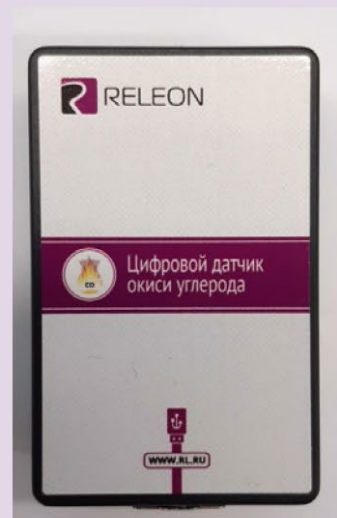
Рис. 11. Датчики кислорода (слева) и угарного газа (справа)