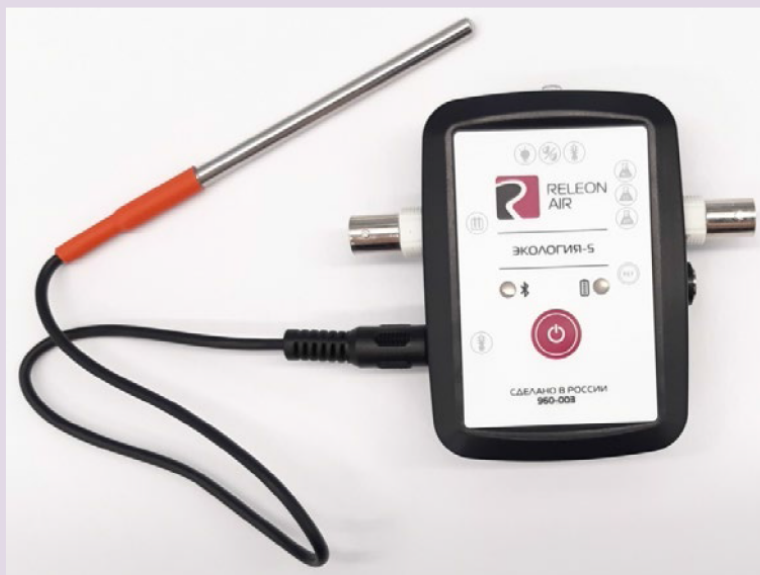
Рис. 6. Датчик температуры растворов

Датчик температуры термопарный предназначен для измерения температур до 900. Используется при выполнении работ, связанных с измерением температур плавления и разложения веществ, а также для измерения температуры в экзотермических процессах.