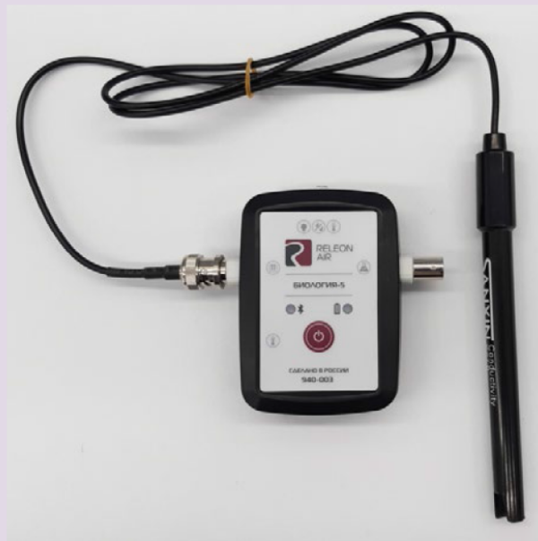
Рис. 5. Датчики электропроводимости

Датчик электропроводимости — предназначен для регистрации и измерения удельной электропроводности жидких сред, в том числе и водных растворов веществ. Применяется при изучении характеристик водных растворов, в том числе почвенных вытяжек.