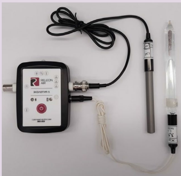
Рис. 10. Ионоселективный датчик (присоединены электро хлорид-ионов и электрод сравнения)

Датчик кислорода — предназначен для определения относительной концентрации кислорода в воздухе. Диапазон измерения: от 0 до 100 %. Разрешение: 0,1 %. Технологические особенности: при измерении содержания газа в выдыхаемом воздухе необходимо держать мембрану максимально близко ко рту; восстановление показаний на воздухе происходит через 1—2 минуты (время диффузии через мембрану).