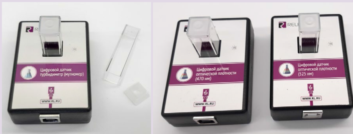
Рис. 8. Датчики мутности (слева), оптической плотности на 465 нм (в центре) и 525 нм (справа)

В комплект входят датчики с различной длиной волн полупроводниковых источников света: 465 и 525 нм. Диапазон измерения коэффициента пропускания света: от 0 до 100 %. Разрешение при измерении коэффициента пропускания: 0,1 %. Диапазон измерения оптической плотности: от 0 до 2 D. Разрешение при измерении оптической плотности: 0,01 D. Длина оптического пути кюветы: 10 мм. Объём кюветы: 4 мл. Технологические особенности: требуется хорошо промывать кювету для исследуемого раствора.