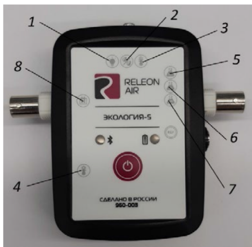
Рис. 2. Мультидатчик по экологии. Обозначение разъёмов и технологических отверстий: 1 — освещённость, 2 — относительная влажность воздуха, 3 — температура окружающей среды, 4 — температура растворов, 5 — нитрат-ионы, 6 — хлорид-ионы, 7 — рН, 8 — электропроводность

Мультидатчик по экологии позволяет измерять следующие показатели: водородный показатель водных сред, концентрации нитрат-ионов и хлорид-ионов, электропроводность, влажность, освещённость, температуру окружающей среды, температуру растворов, растворов и твёрдых тел (рис. 2).