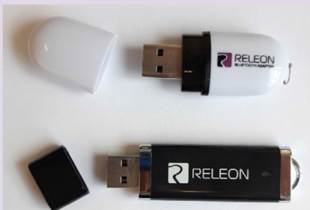
Рис. 13. Общий вид USB-флеш-накопителя (внизу) и Bluetooth-адаптера (вверху) Releon

В комплекте цифровой лаборатории Releon поставляется программное обеспечение Releon Lite на USB-флеш-накопителе, а также Bluetooth-адаптер для связи регистратора данных с беспроводными датчиками (рис. 13).