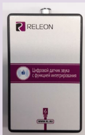
Рис. 7. Датчик звука

Датчик звука — измеряет уровень шумов в окружающей среде и при оценке шумопоглощающих изоляторов. Динамический диапазон: от 30 до 130 дБ. Частотный диапазон: от 50 Гц до 8 кГц. Разрешение: 0,1 дБА (акустические децибелы). Технологические особенности: датчик чувствителен к резким звукам, которые могут дать завышенные результаты измерений.