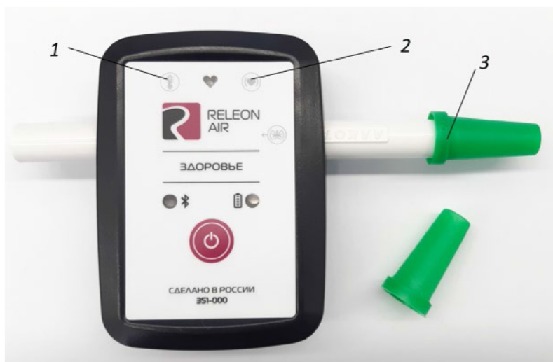
Рис. 3. Мультидатчик по физиологии. Обозначение разъёмов и технологических отверстий: 1 — температура тела, 2 — пульс, 3 — частота дыхания (надет съёмный мундштук)

Мультидатчик по физиологии позволяет определять артериальное давление, пульс, температуру тела, частоту дыхания, ускорение движения (рис 3).